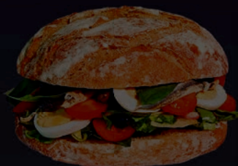
Le pan bagnat

LES PAINS LES BAGNA PANINIS SANDWICHES FOCACIAS WRAPS