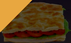
Les Wraps & les Focacias